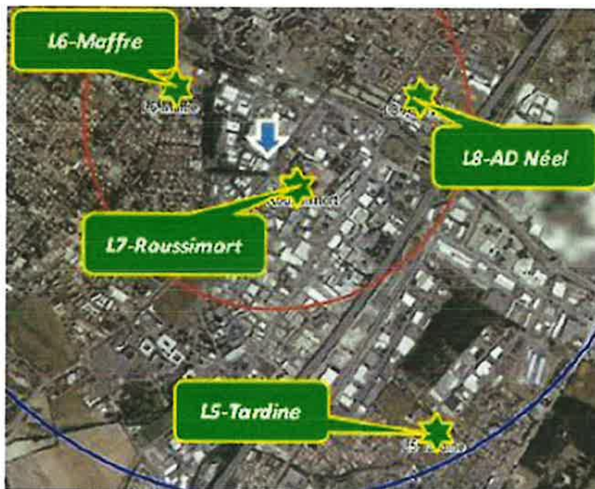
Figure 132 : Points de suivi des lichens

Société dédiée (70% SUEZ et 30% Banque des Territoires) en charge de la concession des Unités de Valorisation Energétique de DECOSET